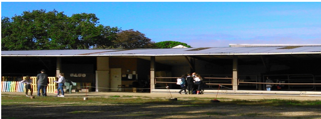
Ces différents ateliers serviront de ressources aux cours de SVT.