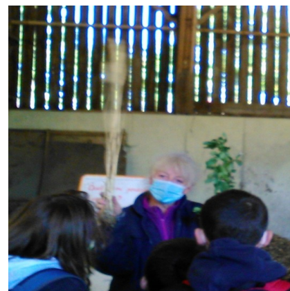
Utilisation de plantes compagnes