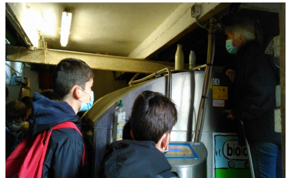
Conservation du lait