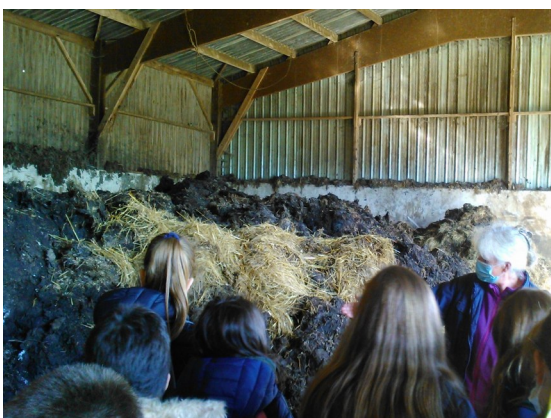
Transformation du fumier en compost