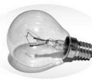
Changement de norme : interdiction des ampoules à incandescence en 2009