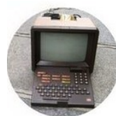
Disparition du besoin : le minitel en 2012

La durée de vie d'un objet technique peut-être plus ou moins longue, de quelques mois à plusieurs dizaines d'années. La fin de vie est liée à la disparition du besoin , au changement de norme , au remplacement par un produit plus performant techniquement et économiquement .