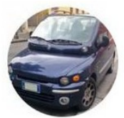
La fiat Multipla a rapidement été remplacée par un modèle plus performant économiquement