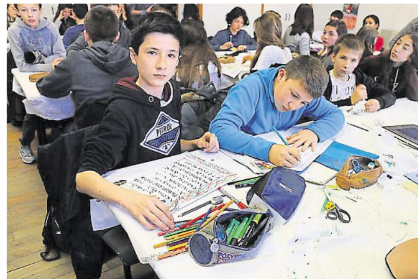
Tous les moyens, même modernes, sont bons pour réaliser un beau manuscrit.