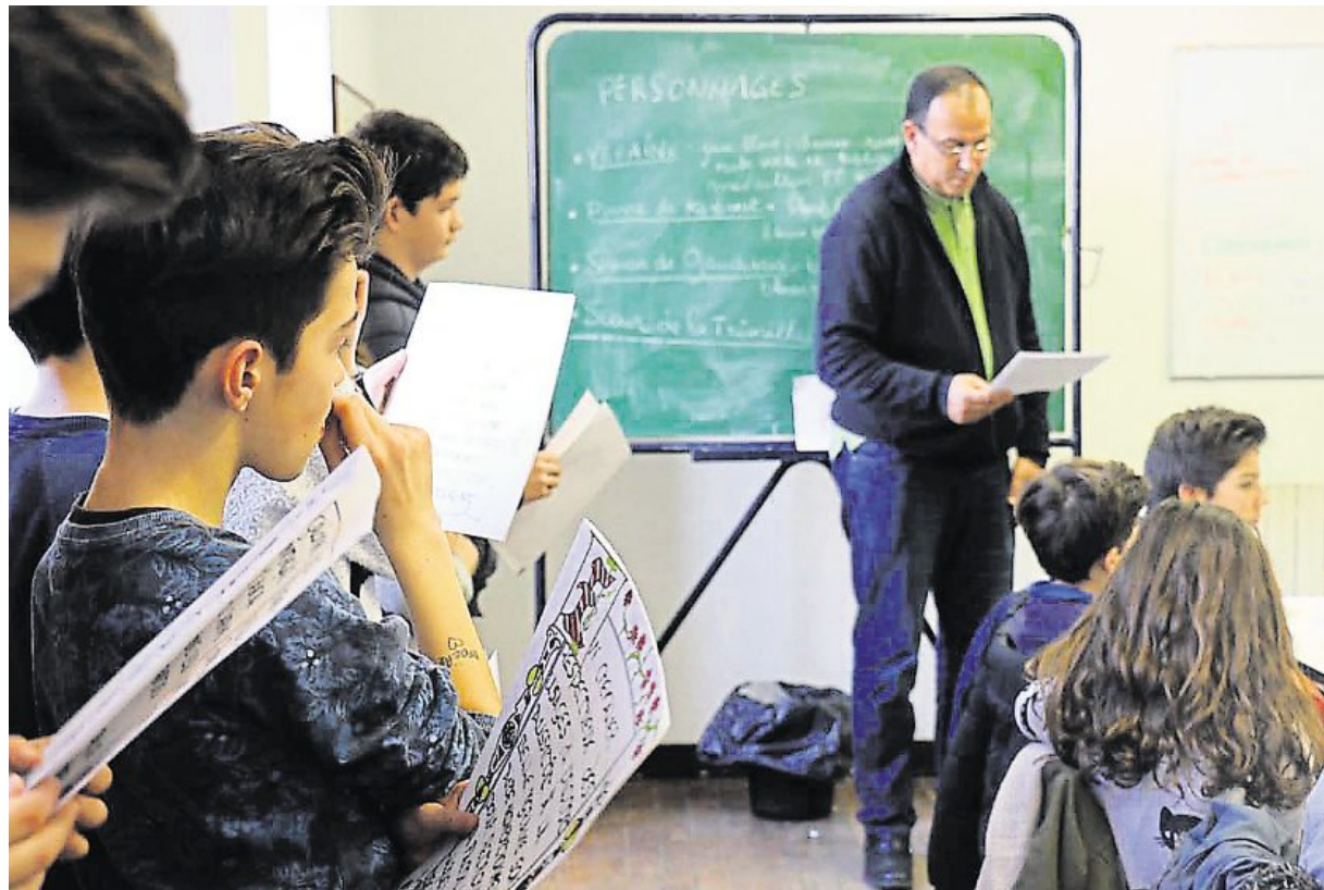
Un tableau, un professeur, des élèves... L'école du patrimoine place Saint-Jean à tout d'une vraie !